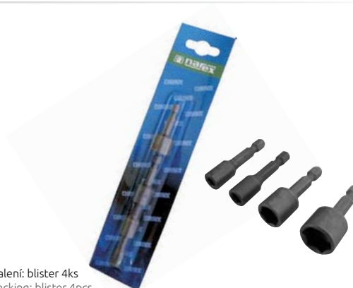
Balení: blister 4ks Packing: blister 4pcs

Složení: 4ks v blistru 4 x SWM Content: 4pcs in blister 4 x SWM